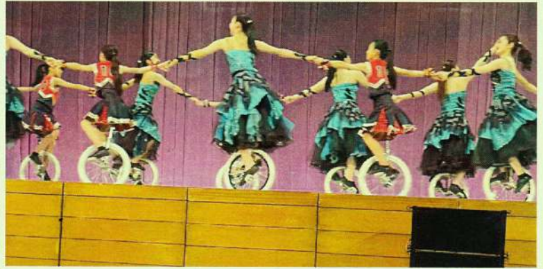
アトラクション ブルーリボン （静岡県城内一輪車クラブ）