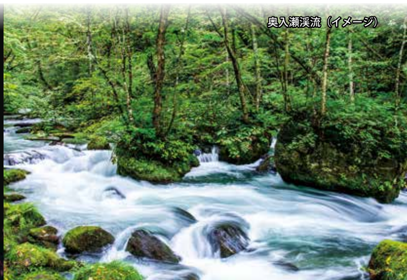
奥入瀬溪流 (イメージ)