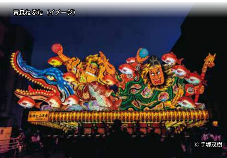
青森ねぶた (イメージ)